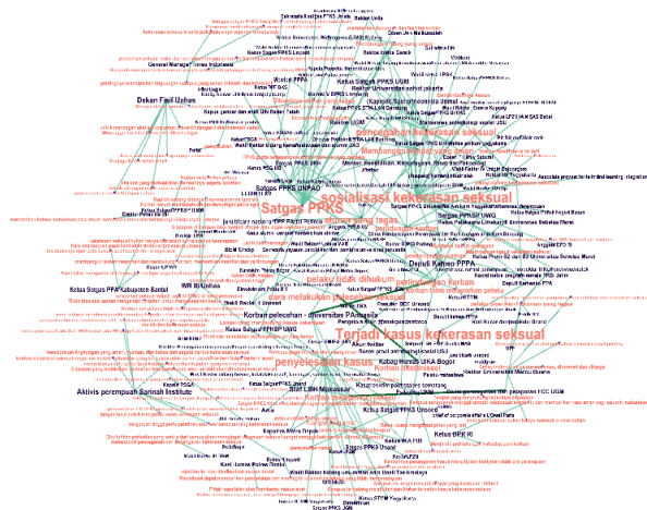
Gambar 3. Jaringan Actor to Concept

Dominasi Aktor dalam hubungan author to concept menggambarkan bagaimana seorang aktor (misalnya, media, penulis, atau organisasi) berperan dalam membentuk wacana melalui konsep-konsep tertentu. Dalam analisis DNA, dominasi aktor dalam hubungan author to concept dapat diukur dengan berbagai pendekatan untuk melihat siapa yang paling aktif, berpengaruh, atau mendominasi. Aktor dengan degree centrality tinggi menunjukkan keterlibatan yang intens dalam diskusi karena memiliki banyak koneksi ke berbagai konsep. Semakin banyak koneksi aktor ke konsep tertentu, semakin dominan aktor tersebut dalam membentuk narasi.